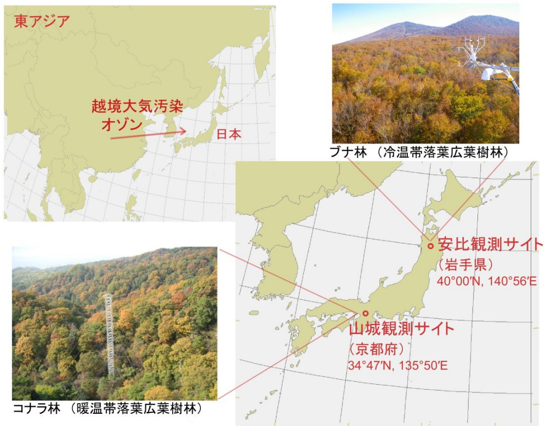
図1. ブナ林とコナラ林におけるオゾンの影響評価 越境汚染物質であるオゾンが森林に与える影響を評価するために、フラックス観測タワーを利用してブナ林とコナラ林における葉のオゾン吸収量と CO 2 吸収量との関係を調べました。